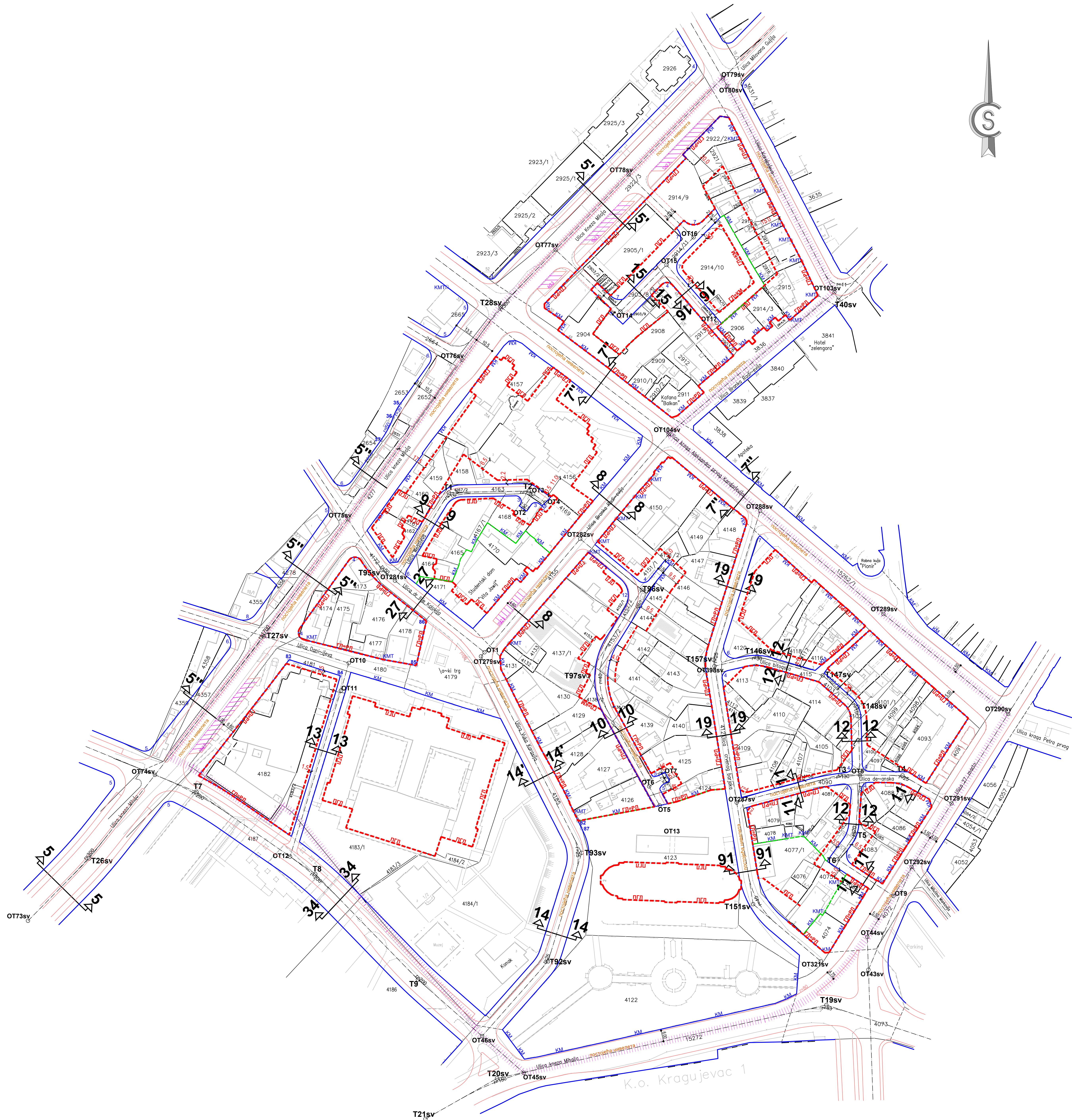
КАРАКТЕРИСТИЧНИ ПРОФИЛИ P= 1:200